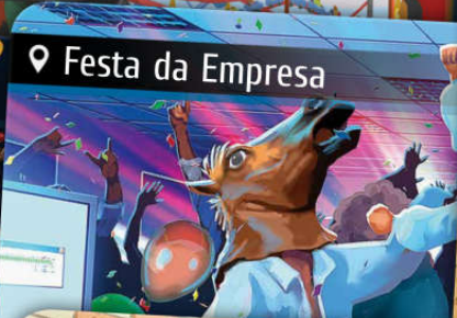
Festa da Empresa